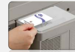
Lector de tarjetas