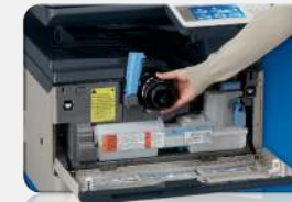
Fácil acceso al tóner

Acceda rápidamente a las sencillas instrucciones paso a paso desde la interfaz de usuario.