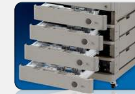
Acceso al papel mediante un botón